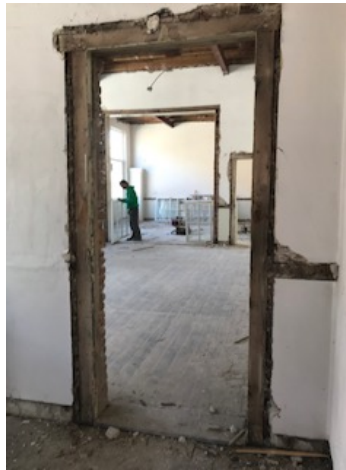
De eerste en tweede klas

Bovengang (doorgebroken van meisjesschool->jongensschool)