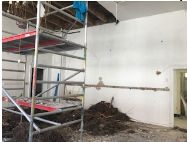
Kleuterklas – begane grond, straatkant

Zij zeiden dat ze maart 2021 nu als doel hebben... Ik hou jullie op de hoogte!